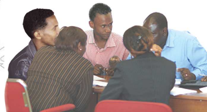
ውሳኔ ላይ ለመድረስ ውይይት አስፈላጊ ነው (ደበበ ኃ/ጊዮርጊስ። ካዕታተመ ዩኤፍ የተወሰደ)